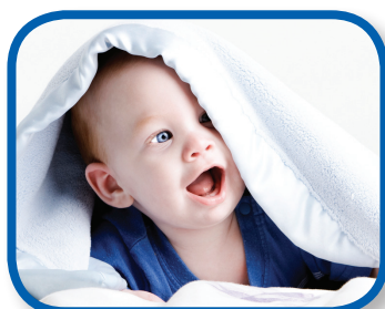
Peek-a-Boo for Two 6-12 months