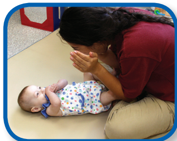
Peek-a-Boo 2-12 months