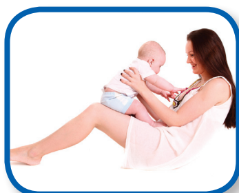
Ride a Little Horse 4-6 months