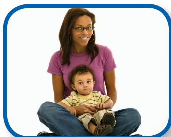
Row Your Boat 3-9 months